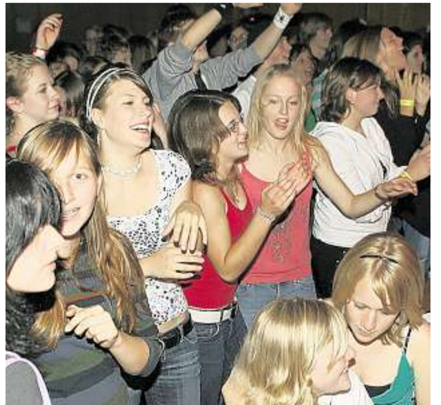
Volles Haus: In der vollbesetzten Aula herrschte eine Bombenstimmung.