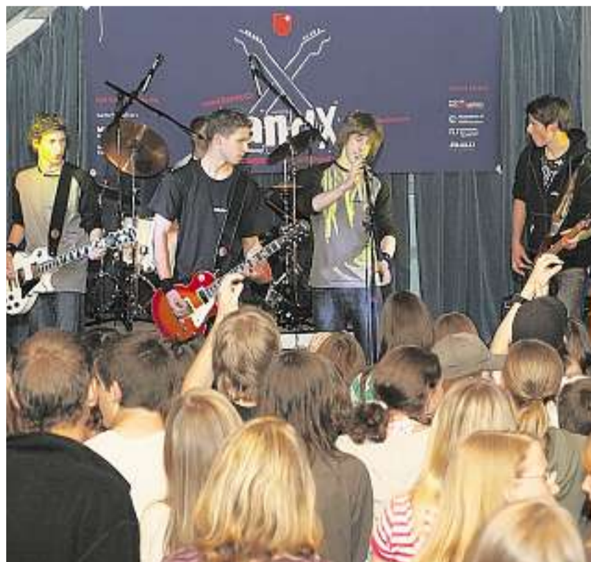
Vor eigenem Publikum: Die Illgauer «Backdraft» genossen in der Muotathaler Aula einen Heimvorteil.

tionen nicht scheuen. Ein Heimspiel hatten natürlich die «MaRa» und «The Mosis» aus Muotathal sowie die Illgauer «Backdraft». Sie gaben vor eigenem Publikum so «richtig Gas», und hätte das Publikum bewerten dürfen, dann wären die Besten wohl garantiert aus diesem Trio bestimmt worden. Wer es unter die letzten sechs schafft, wird erst nach den noch bevorstehenden Ausscheidungen in Pfäffikon (9. Juni) und Einsiedeln (30. Juni) bekannt gegeben.